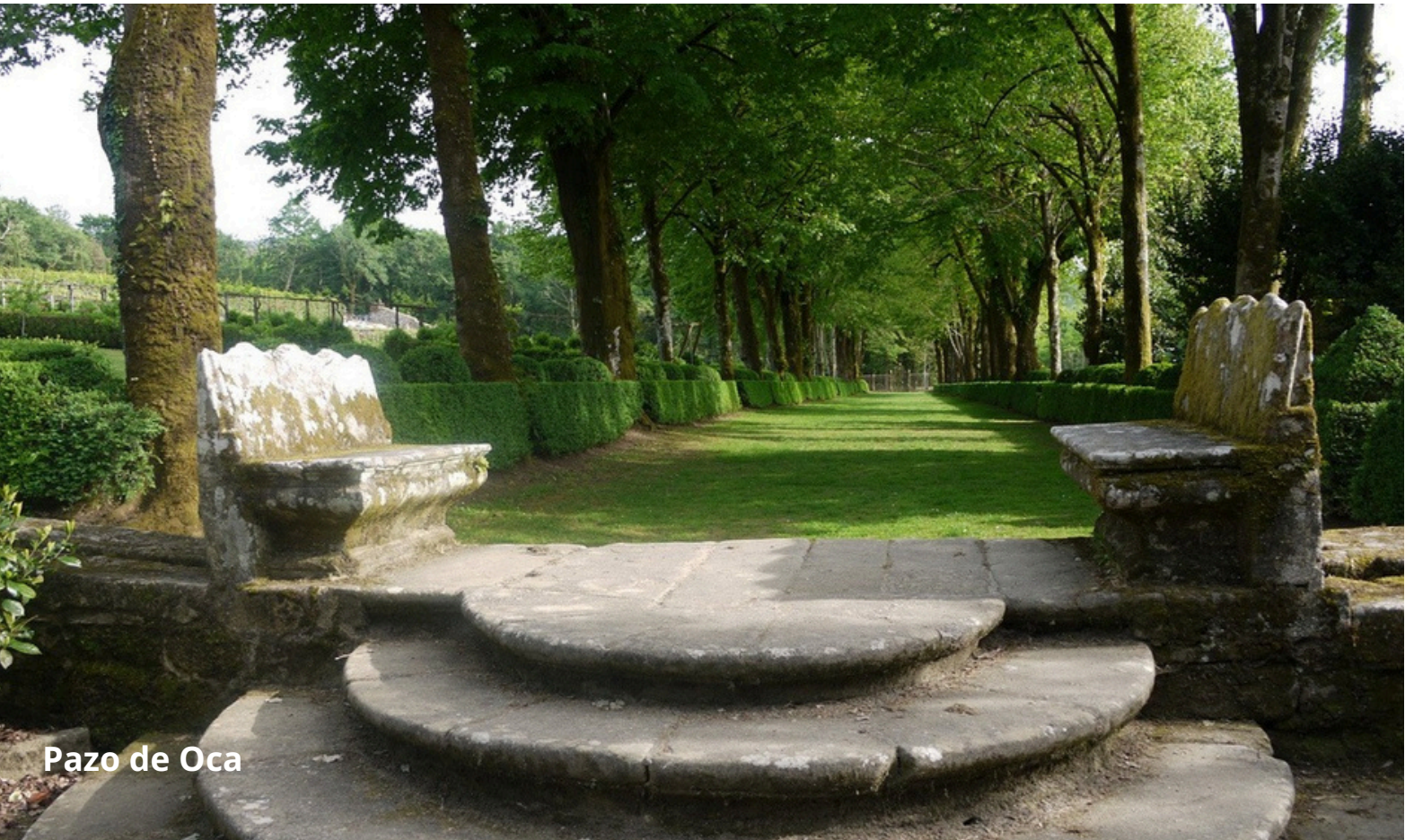
Pazo de Oca