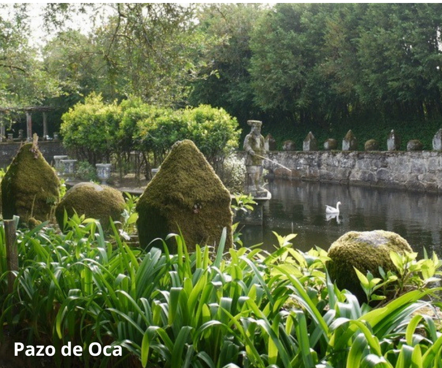
Pazo de Oca