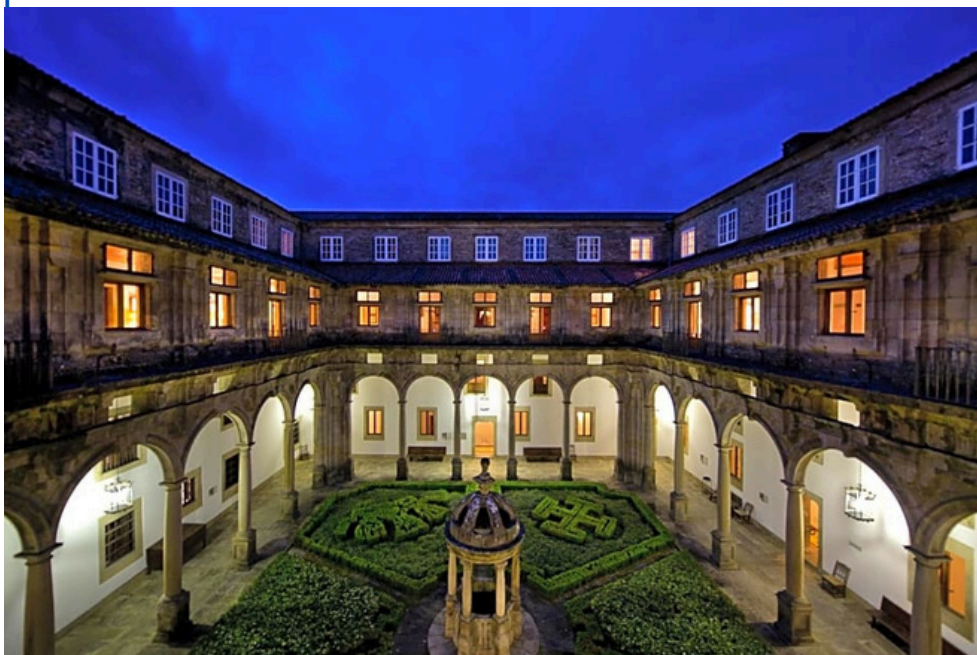
Parador de Santiago - Hostal Reis Catolicos