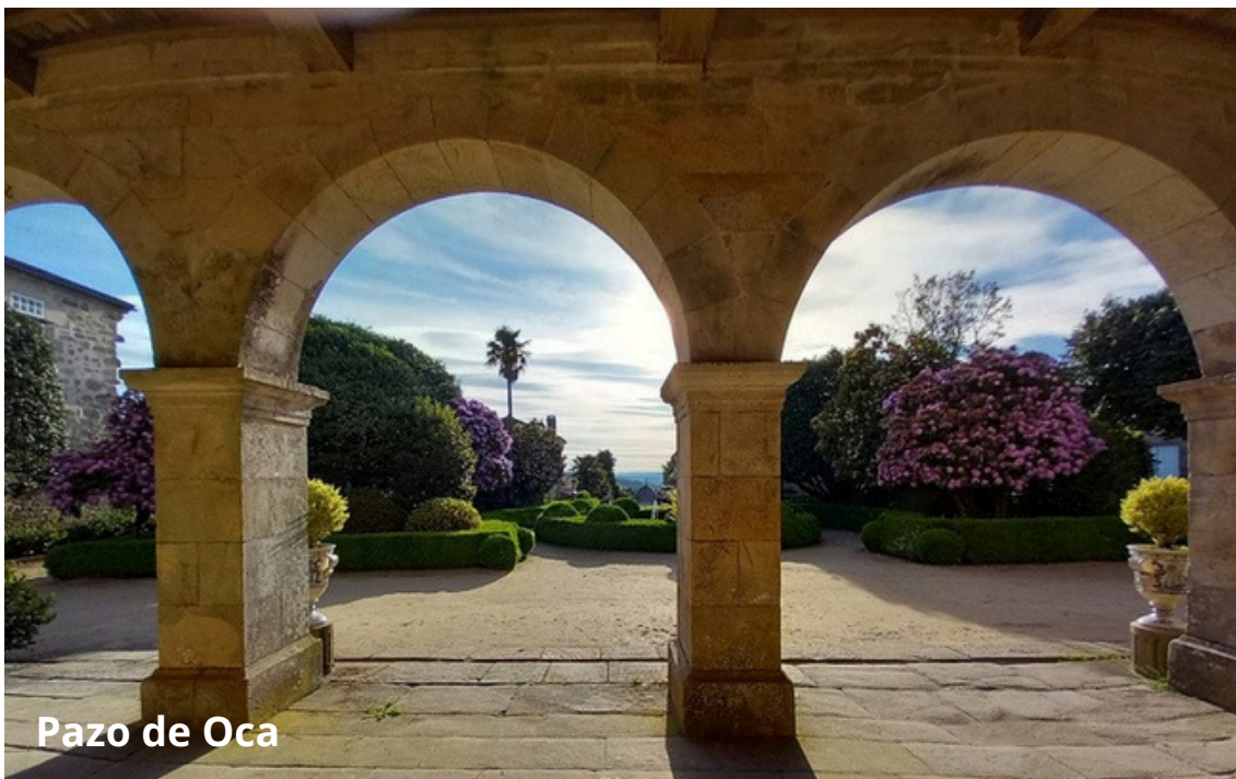
Pazo de Oca