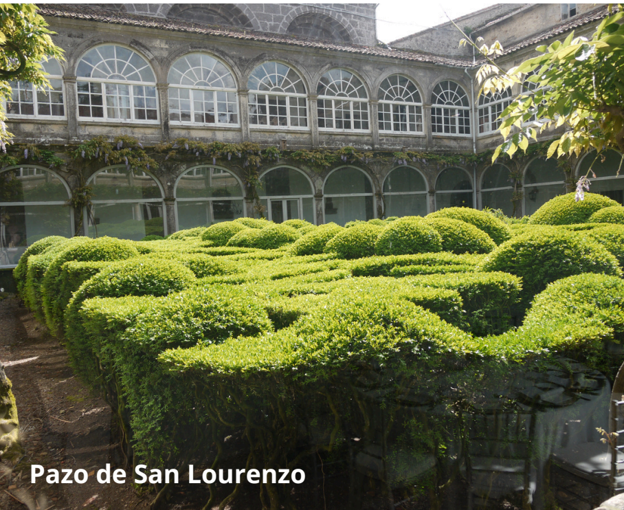
Pazo de San Lourenzo