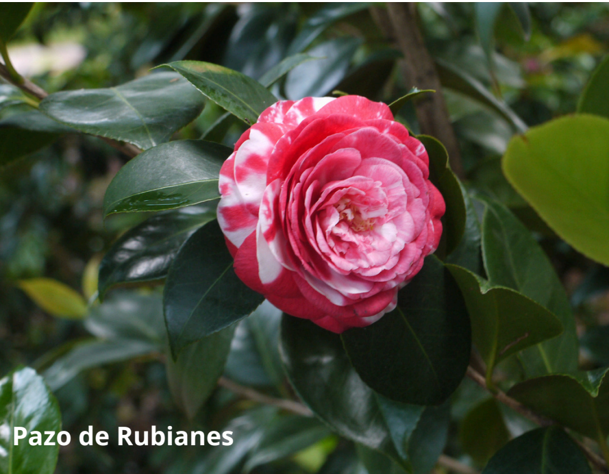
Pazo de Rubianes