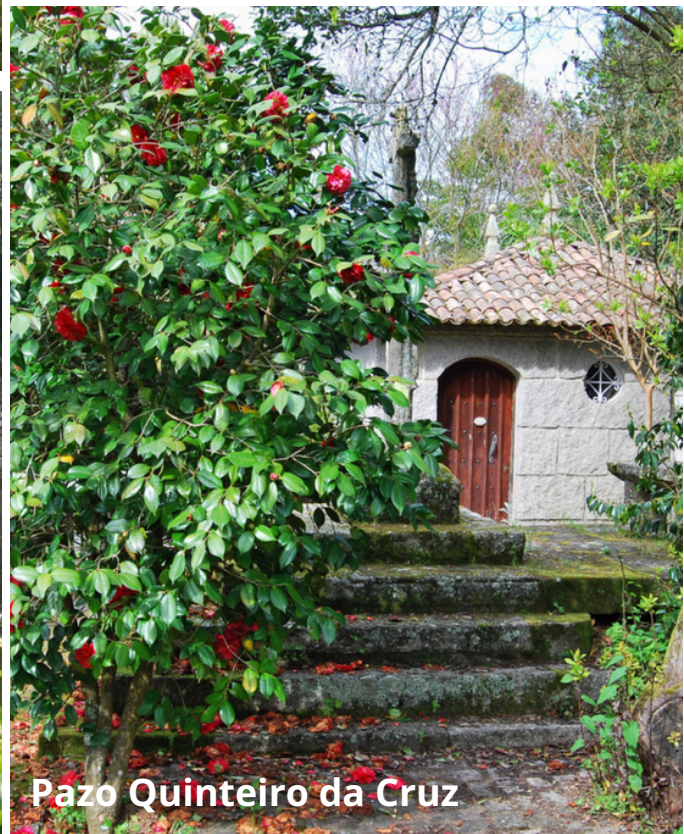
Pazo Quinteiro da Cruz